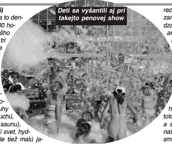
Deti sa vyšantili aj pri takejto penovej show

a Wellness & SPA a to denne od 10.00 do 22.00 hodiny. V ponuke nášho wellness centra sú tri vnútorné termálne bazény, saunový svet a tiež široká ponuka masáží. Najvhodnejším relaxom pre našich návštevníkov je práve saunový svet, ktorý obsahuje štyri druhy saun (bylinkovú, suchú, infra a parnú soľnú saunu), tepidárium, sprchový svet, hydromasážnu vaňu, ale tiež malú jacuzzi pre 4 osoby.