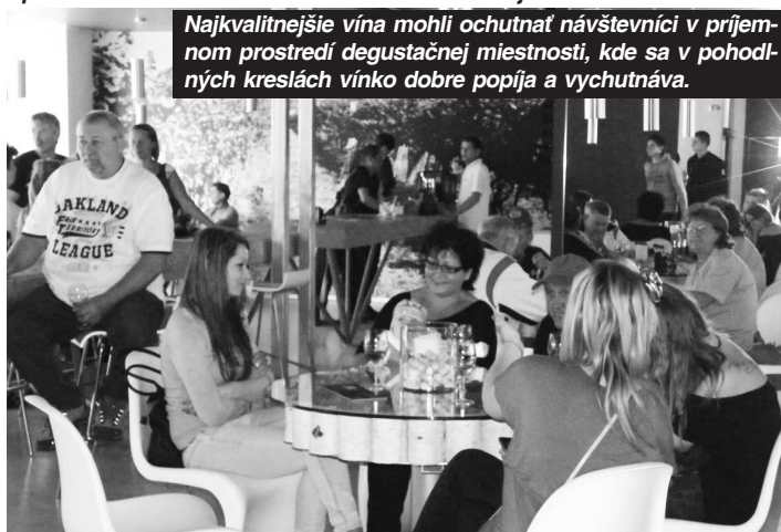
Najkvalitnejšie vína mohli ochutnať návštevníci v príjemnom prostredí degustačnej miestnosti, kde sa v pohodlných kreslách vínko dobre popíja a vychutnáva.