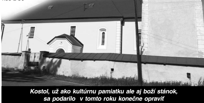
Kostol, už ako kultúrnu pamiatku ale aj boží stánok, sa podarilo v tomto roku konečne opraviť