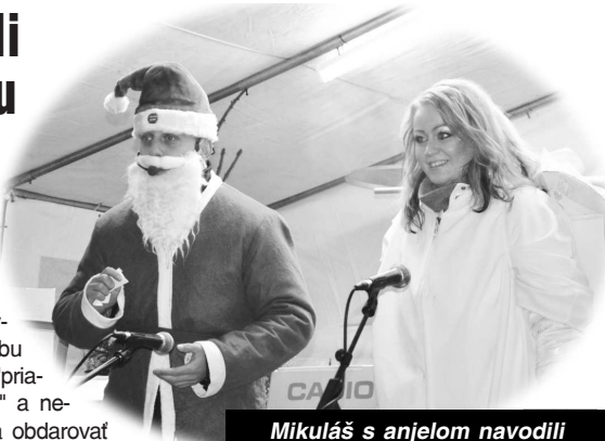
Mikuláš s anjelom navodili správnu atmosféru...