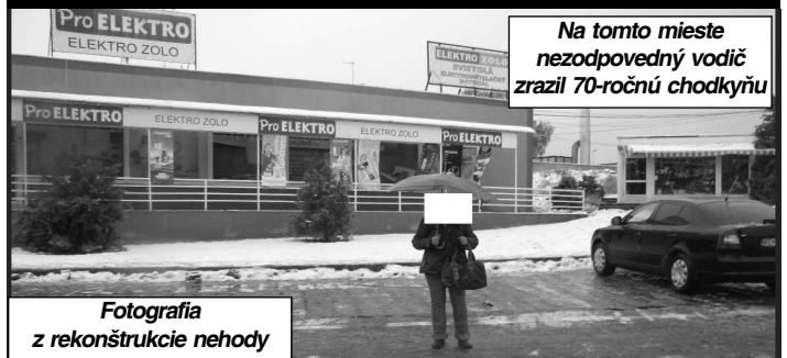
Fotografia z rekonštrukcie nehody

Na tomto mieste nezodpovedný vodič zrazil 70-ročnú chodkyňu