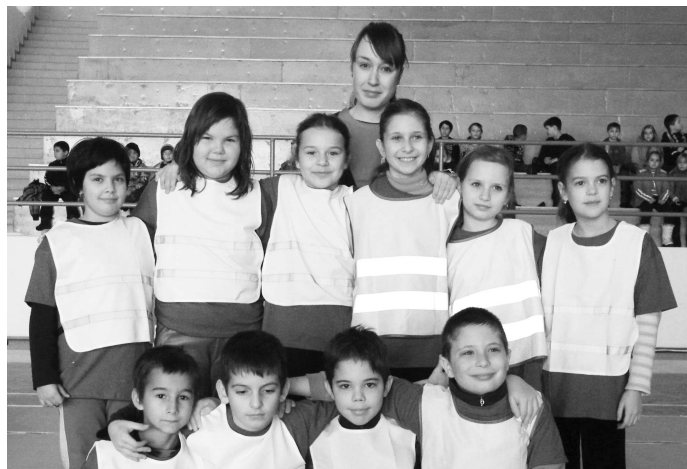
Každá škola vytvorila jedno súťažiacie družstvo zo žiakov tretích a štvrtých ročníkov