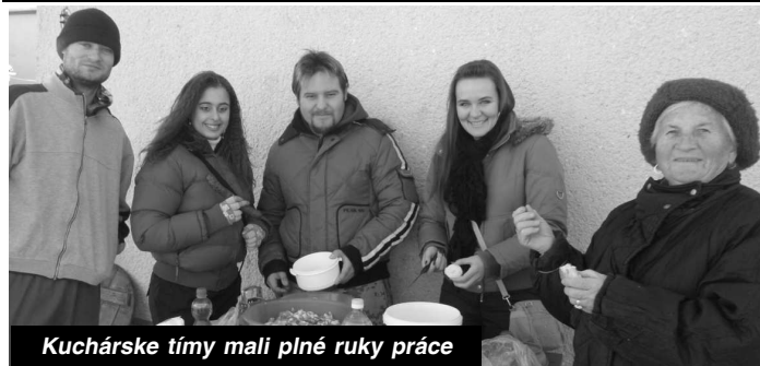
Kuchárske tímy mali plné ruky práce