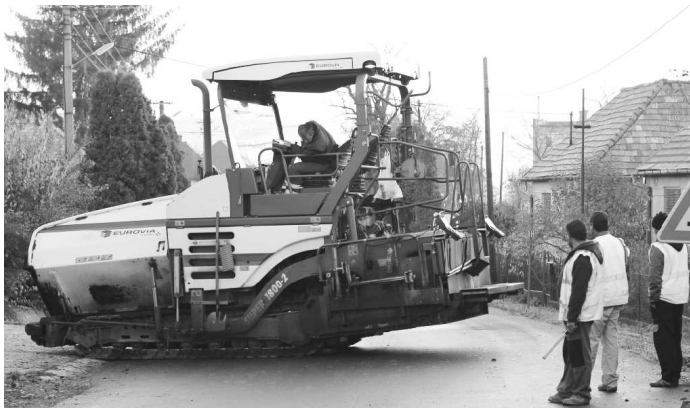
Na cestu pozdĺž hranice s napojením na hraničný most Peťov - Pösténypuszta už nastúpili ťažké mechanizmy a stavebné tímy pracovníkov

"OBSAH TOHTO ČLÁNKU NEREPREZENTUJE OFICIÁLNE STANOVISKO EURÓPSKEJ ÚNIE"