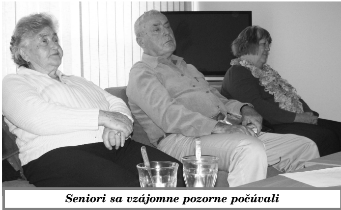
Seniari sa vzájomne pozorne počúvali