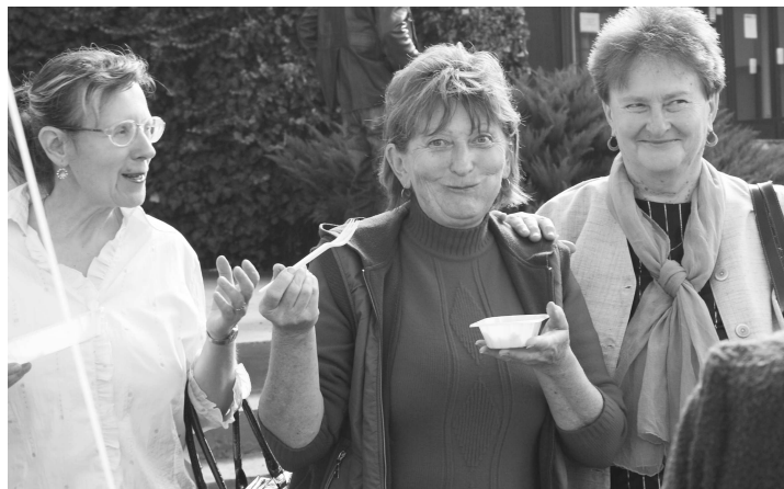
Tradičné fľačky s kapustou, ktoré pripravili členovia spolku Viktoria, chutili všetkým návštevníkom