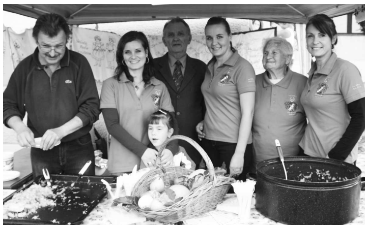
Na organizácii tohto podujatia sa podieľal aj KS Viktoria