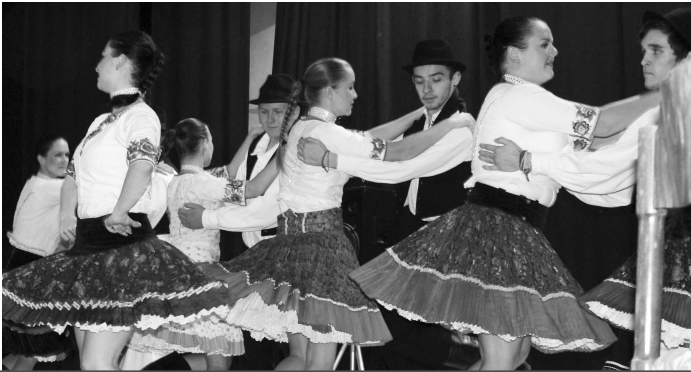
Krtíšan na záver kultúrneho programu ku Mesiacu úcty k starším rozihral žilky v telách aj najstarších obyvateľov Želoviec