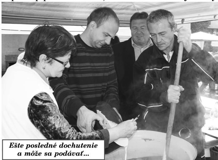
Ešte posledné dochutenie a môže sa podávať...