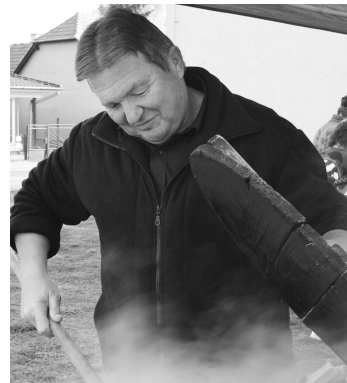
Ruku k dielu priložil aj starosta, ktorý spolu s pracovníkmi obecného úradu pripravili zabíjačkovú kapustnicu so smotanou