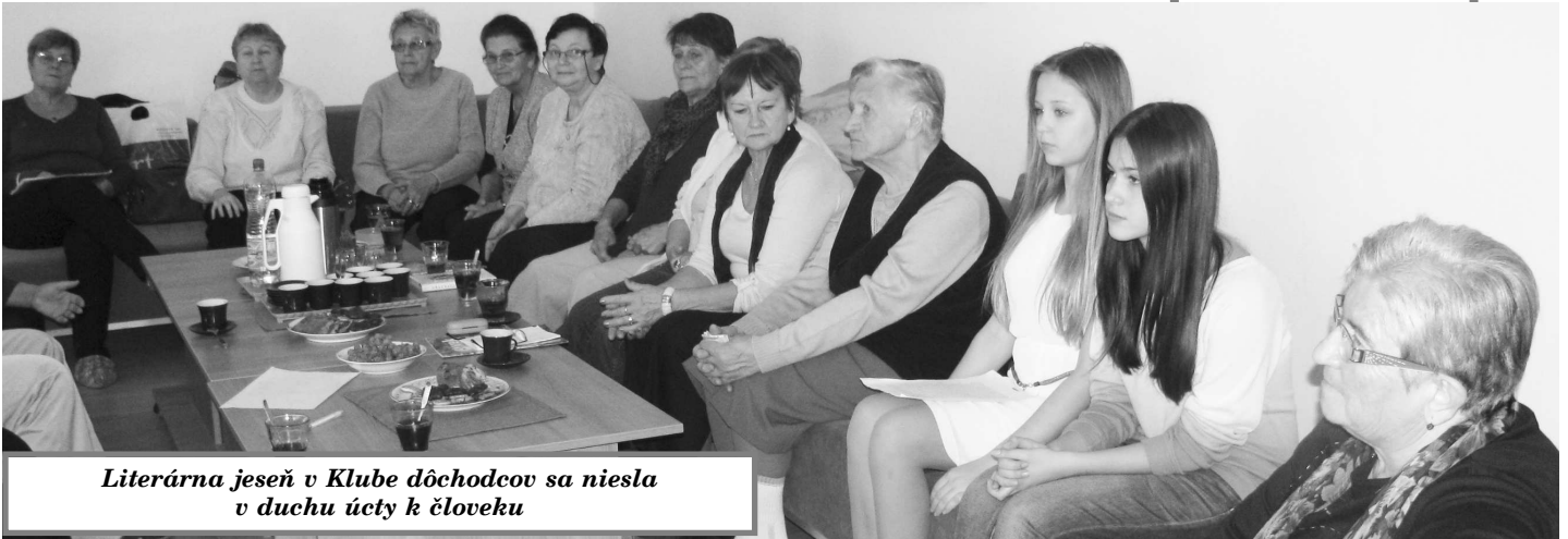
Literárna jeseň v Klube dôchodcov sa niesla v duchu úcty k človeku